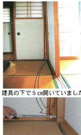
建具の下で5cm開いていました

最近水はきれいにする機械がたくさんあってどれがよいのかは解りませんが、この機械をつけて水道水が滑らかになり、カルキ臭さも無くなって飲みやすくなりました。町外に住む娘も喜んでこの水を取りに来ています。