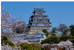
改修前の姫路城天守閣

この秋は本当に忙しい中でしたが、二つのお城を見学することができました。姫路城と松本城です。姫路城は現在平成の大改修中で、天守閣を仮設の建物で取り囲んで、見学者に工事の状況まで見学させてくれました。また、松本城は以前の地震で石積みが壊れたのを改修していました。