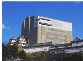
天守閣を囲って工事中に雨や風にさらされないようにしています