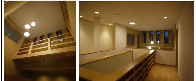
(下の言葉との関連はありません)