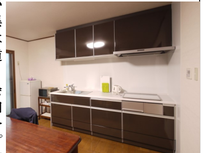
キッチンのビフォー アフター 上がビフォー 下がアフター